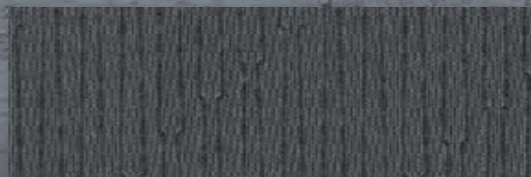
Обивка сидений однотонной серой тканью