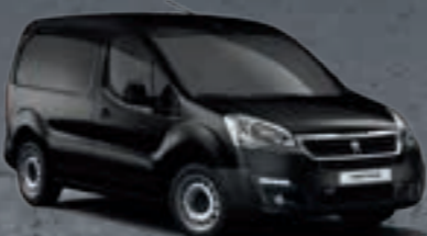
Черный металлик «NOIR PERLA NERA»