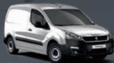
Серебристый металлик «GRIS ALUMINIUM»