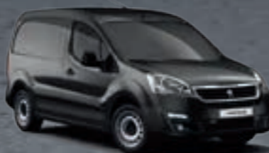
Серебристый металлик «GRIS SHARK»