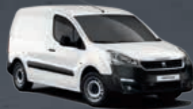
Белый неметаллик «BLANC BANQUISE»